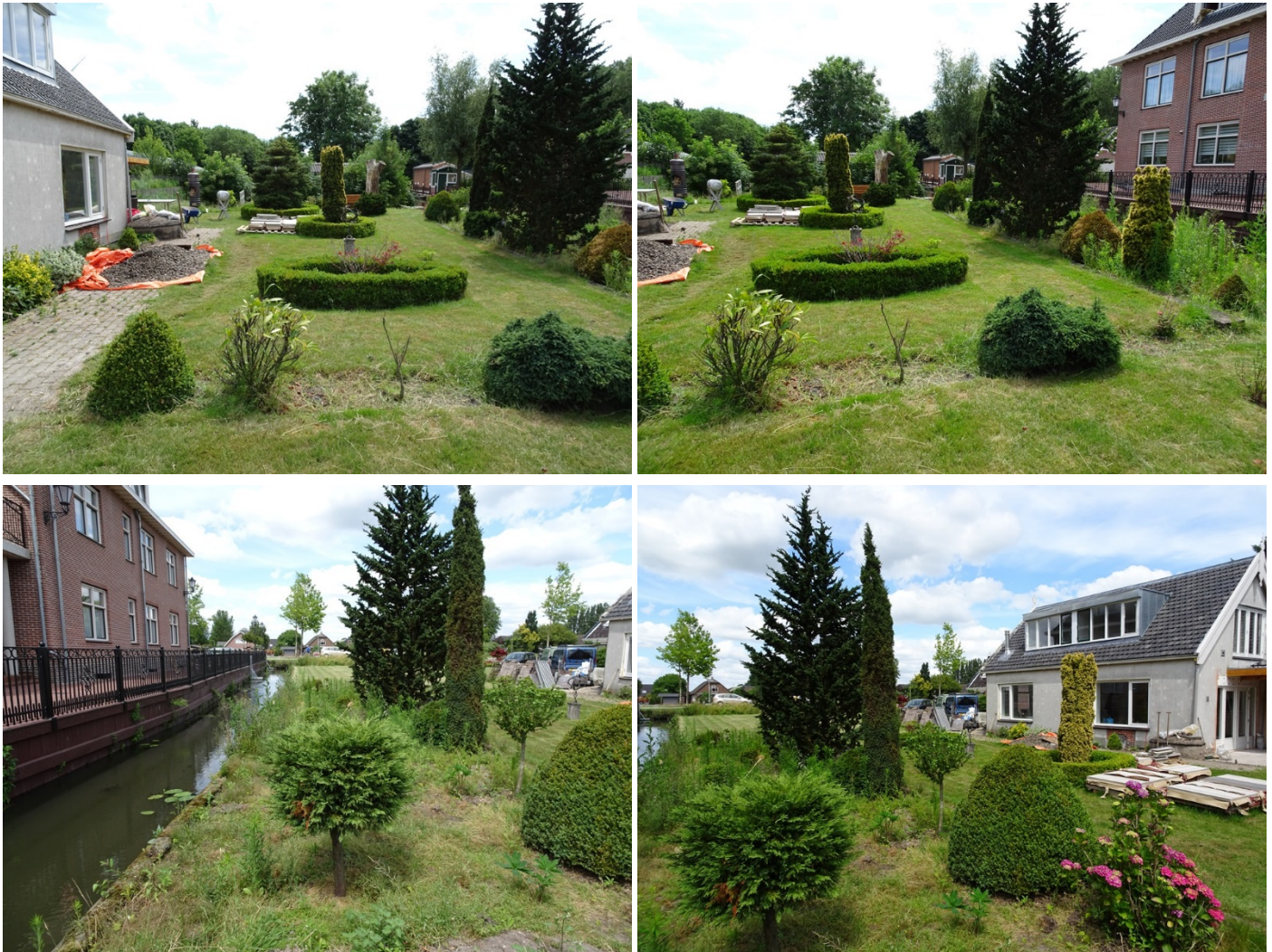
Figuur 3. Het middengedeelte van de tuin bestaat naast gras voornamelijk uitliguster en conifeer. Planten die voor wilde bijen ongeschikt zijn. Deze cultivars kan men afwisselen met een mengvorm van inheems planten die geschikt zijn voor wilde bijen. Tabel 1 geeft een lijst, deze is niet uitputtend, van geschikte planten voor wilde bijen. Voor andere ideeën voor mogelijke planten soorten zie: http://www.bijenlandschap.nl/zet-je-in/poot-deze-bollen-of-planten/ .

Naast aanpassing van het maaibeheer kunnen ook actief kruiden worden ingezaaid om zo meer bloemen te krijgen. Zo kan grote ratelaar ( Rhinanthus angustifolius ) worden ingezaaid. Deze halfparasiet parasiteert op gras en voelt zich thuis in matig vochtige voedselrijke graslanden. Door grote ratelaar neemt de grasgroei in snelheid af en ontstaan er meer open plaatsen in de graszoden, waardoor andere kruiden de kans krijgen zich te ontwikkelen. De randen van de (voor)tuin kan men inzaaien met fluitenkruid ( Anthriscus sylvestris ), ook wel boerenkant genoemd. Deze weelderige bloeiende randen vormen een prima voedselbron voor wilde bijen en zweefvliegen.