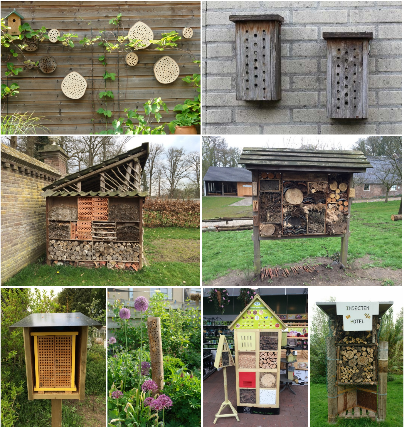
Figuur 6. Zoals de bovenstaande foto's laten zien bestaan er veel verschillende typen bijenhotels. Uiteenlopende materialen kunnen hiervoor worden gebruikt, die dienen als nestelgelegenheid. Belangrijke aandachtspunten voor bijenhotels zijn: